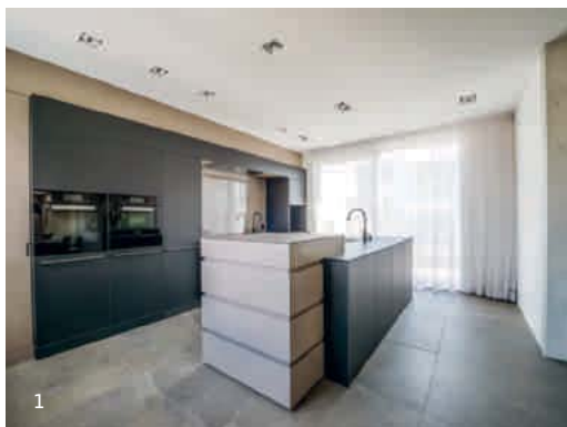
1 | Küche in Dübendorf 2 | Ferienwohnung in Gstaad 3 | Detail Auszug Linoluemküche

umgesetzt, welche als Grundlage für die Ausführungspläne in der Werkstatt dienen. Für die Ausführung stehen ausgebildete Fachkräfte zur Verfügung, die bei Bedarf auch alle externen Gewerke für den gesamten Umbau koordinieren und beaufsichtigen, sodass es für den Auftraggeber nur einen Ansprechpartner gibt. Ebenfalls übernimmt das Kissling-Team bei Bedarf auch die Baukosten- und Terminkontrolle. Durch diese seltene Kompetenz von Planung bis Ausführung unterscheidet sich die Firma Kissling von den meisten herkömmlichen Schreinerbetrieben. Die kompetente und besonnene Vorgehensweise gepaart mit einer sachkundigen Ausführung auf höchstem Niveau hat auch dazu geführt, dass deren Arbeiten bereits mehrfach mit Preisen ausgezeichnet wurden, wie zum Beispiel dem Kitchen Award 2013 und 2017 für die schönste Küche und den schönsten Umbau.