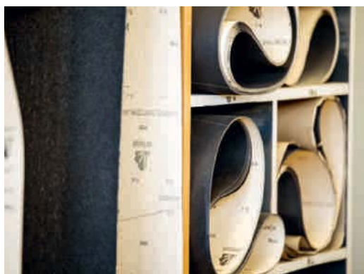
Alles in Handarbeit und in perfekter Ordnung.

Text: Judith Raeber